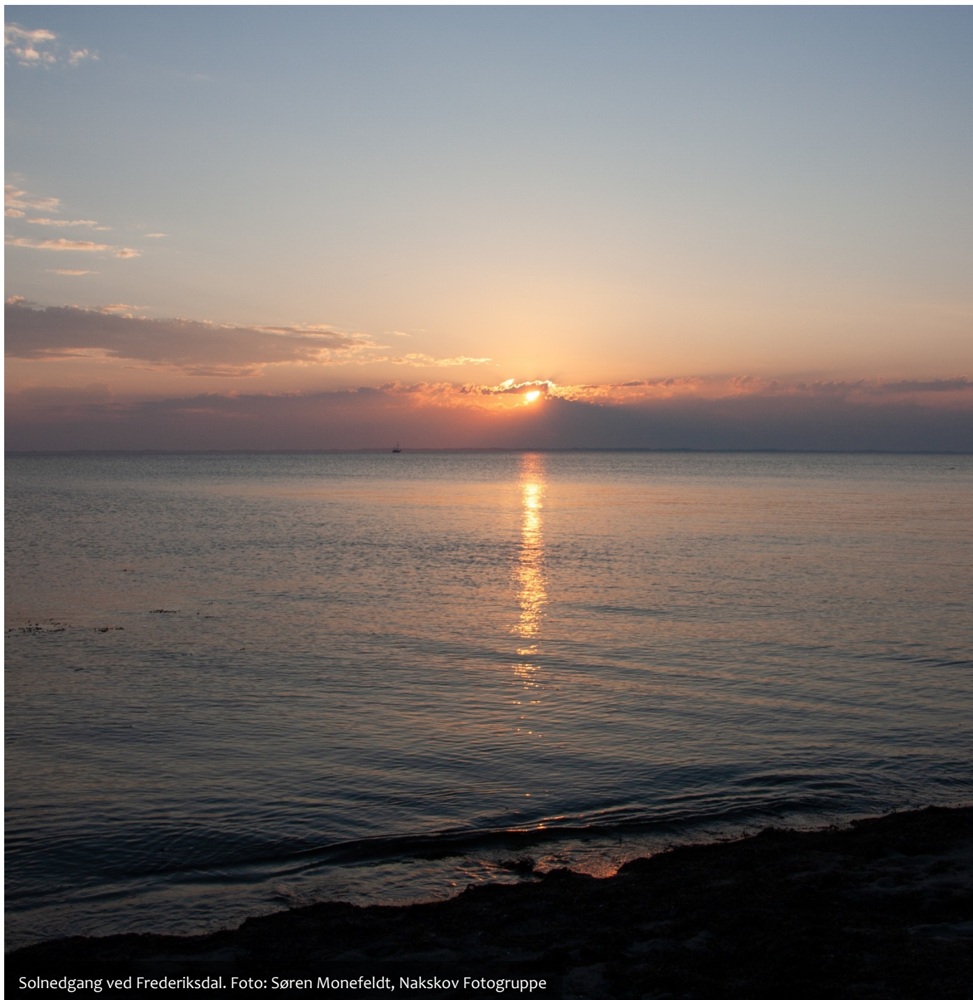
Solnedgang ved Frederiksdal.

Om, og i givet fald hvilken indflydelse dette vil kunne få - f.eks. på bl.a. antallet af henvendelser til borgerrådgiveren - må tiden vise.