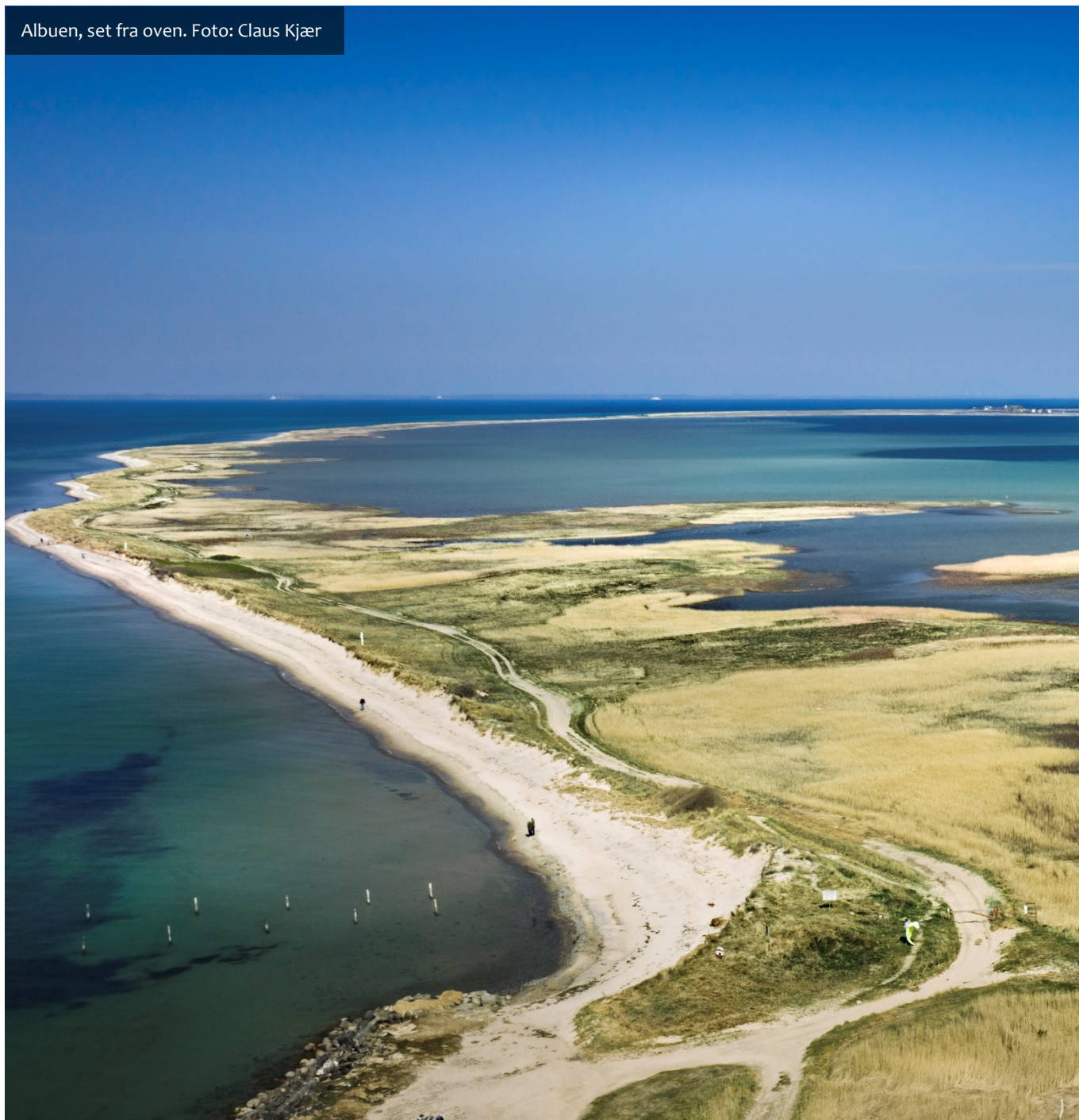
Albuen, set fra oven.

"Afslutningen" på sagen blev, at borger valgte at tage ophold på et forsorgshjem (ej i Lolland Kommune), og ved efterfølgende telefonsamtale gav borger udtryk for, at "befinde sig et godt sted, være omgivet af hjælpsomme mennesker, og føle sig optimistisk i troen på hvad fremtiden vil bringe" .