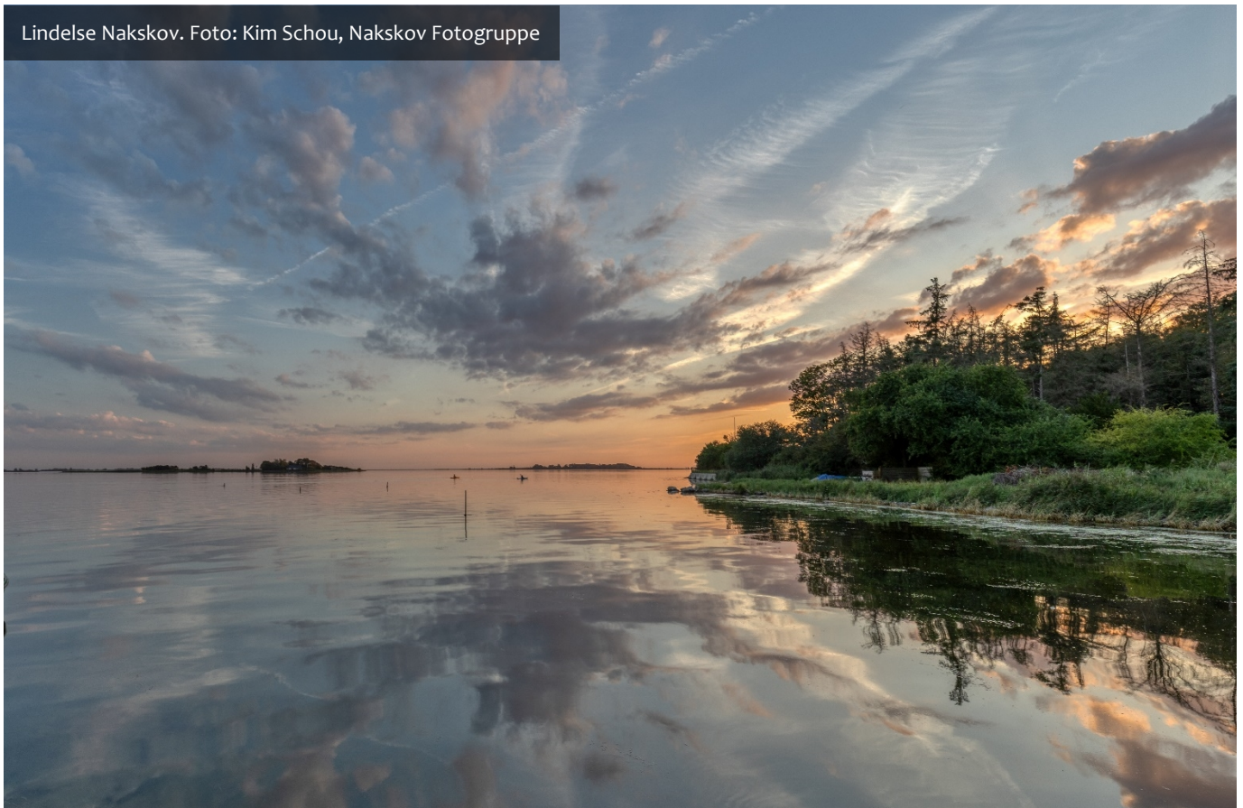
Lindelse Nakskov.

Der kan derfor blot ønskes borger alt det bedste, og håbe på at denne med tiden vil kunne finde lidt mere "indre ro", som udover specifikt at mindske antallet af henvendelser til borgerrådgiveren, måske også generelt vil kunne reducere antallet af opgaver for en række forvaltninger, medarbejdere og politikere i Lolland Kommune, og for den sags skyld også eksterne myndigheder og instanser som Sydsjælland og Lolland-Falsters Politi, Ankestyrelsen og Folketingets Ombudsmand m.fl.