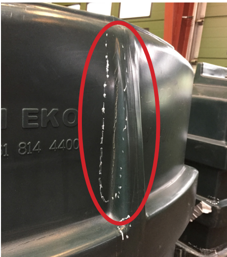
Revnedannelse ved lodret indadgående hulning