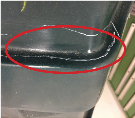
Krakelering samt begyndende revnedannelse i hulning