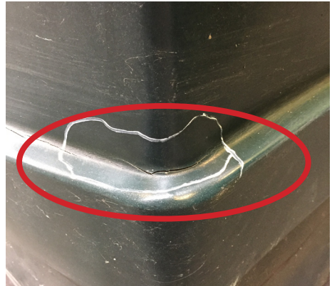
Revne opstået i indadgående hulning